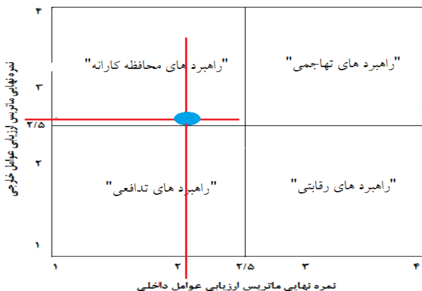
شکل شماره ۲. ماتریس داخلی خارجی توسعه سواحل مکران

می‌توان گفت راهبردهای محافظه‌کارانه (WO) برای توسعه منطقه در اولویت قرار دارند. با راهبرد محافظه‌کارانه می‌توان با کاستن از ضعف‌های منطقه، حداکثر استفاده را از فرصت‌های موجود بُرد.