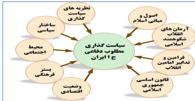
شکل ۱: عوامل مؤثر در سیاست‌گذاری دفاعی ج.ا.ایران

یکی از وظایف مهم مدیران، طراحان و استراتژیست‌های نظامی در سطح کلان یک کشور، تدوین سیاست‌های دفاعی است و عوامل متعددی در تدوین سیاست‌های دفاعی یک کشور تأثیرگذار هستند. با استناد به نظریات و مدل‌های سیاست‌گذاری دفاعی و عوامل مؤثر بر سیاست‌گذاری دفاعی برگرفته از اندیشمندانی همچون: «چگینی، درویشی، کلانتری و افتخاری، عسگری، دانش آشتیانی»، عوامل مؤثر در سیاست‌گذاری دفاعی ج.ا.ایران به شرح شکل شماره ۱ ترسیم شده است.