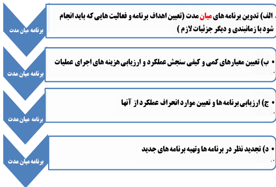
شکل ۲. فرآیند برنامه‌ریزی میان‌مدت (ایزدی، ۱۳۹۱: ۴۷)