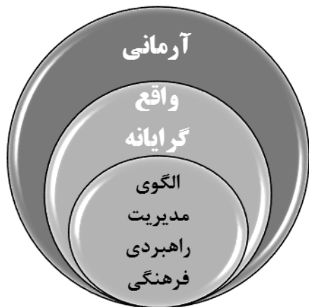
شکل ۲. سطوح راهبردی الگوی مدیریت فرهنگی

با نگاهی جامع‌نگر به «الگوی مدیریت راهبردی فرهنگی»؛ دو سطح «واقع‌گرایانه» و «آرمانی» متصور است، چه این‌که از سویی تدوین این الگوی با «روش استقرائی» قاعداً از زمینه‌ها و ضرورت‌هایی برخوردار است که لاجرم این مبانی در «سطح واقع‌گرایانه» باید مورد توجه قرار گیرد، و از دیگر سو و در راستای «مهندسی فرهنگ» و «اِعمال مدیریت فرهنگی»؛ نخست باید فرهنگ آرمانی شناخت شود و سپس مؤلفه‌ها و شاخص‌های فرهنگ