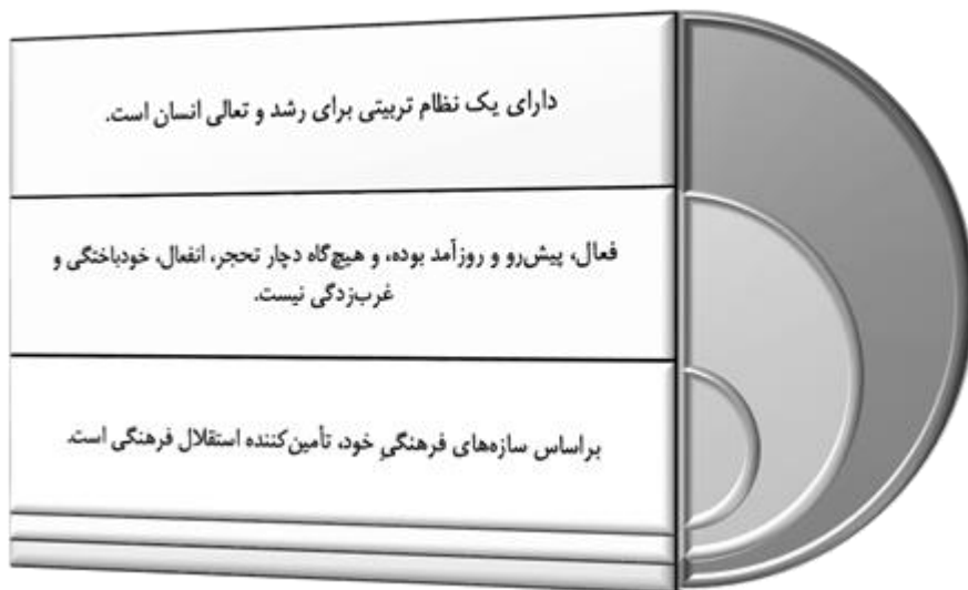
شکل ۱. ویژگی‌های «نظام فرهنگی» از منظر حضرت امام خمینی (ره)