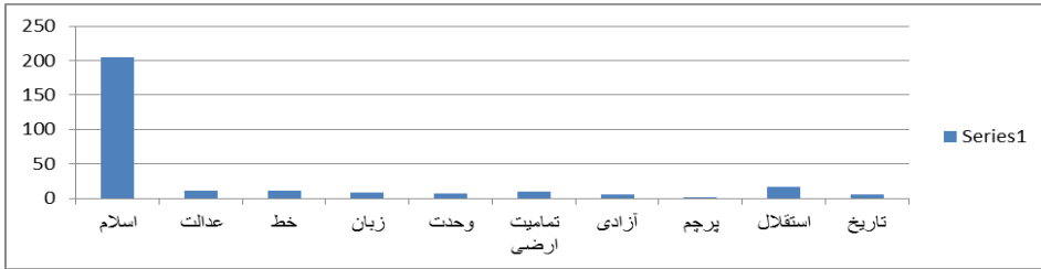
مؤلفه‌های اتحاد ملی طبق تحلیل تفسیری قانون اساسی