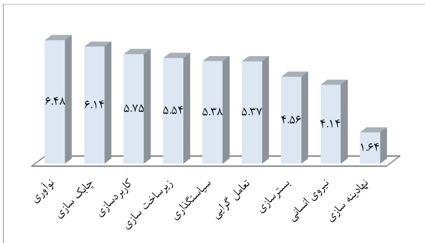
نمودار شماره ۲: رتبه شاخص مسائل راهبردی احصاء‌شده در حوزه فناوری‌های حوزه کسب و کار بر اساس تحلیل آزمون فریدمن

با توجه به موارد مطرح‌شده، رتبه راهبردهای کلیدی احصاء‌شده در حوزه کسب‌وکارها در نمودار زیر نشان داده شده است. همان‌گونه که مشخص است به‌ترتیب نوآوری، چابک‌سازی، کاربردسازی، زیرساخت‌سازی، سیاست‌گذاری، تعامل‌گرایی، بسترسازی، نیروسازی و نهادینه‌سازی در رتبه‌های ۱ تا ۹ قرار می‌گیرند.