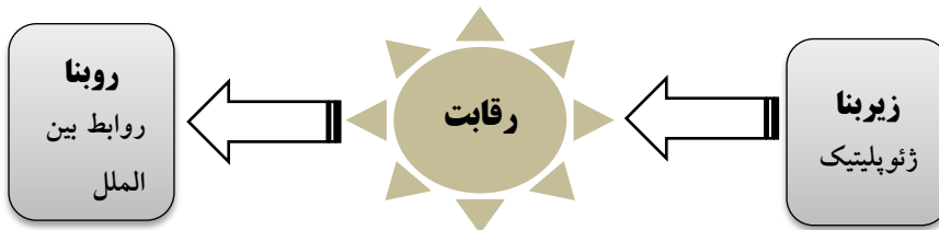
شکل (۱) رابطه خطی بین عامل جغرافیای سیاسی، رقابت و روابط بین‌الملل

۸۵). از این رو، می‌توان مطالعه روابط بین‌الملل را دانش روبنایی بررسی رقابت و ژئوپلیتیک را دانش زیربنایی تولید رقابت دانست و در این راستا بدیهی است که فضای جغرافیای سیاسی جهان به مثابه ظرف تولید ساختارهای روبنایی روابط بین‌الملل است.