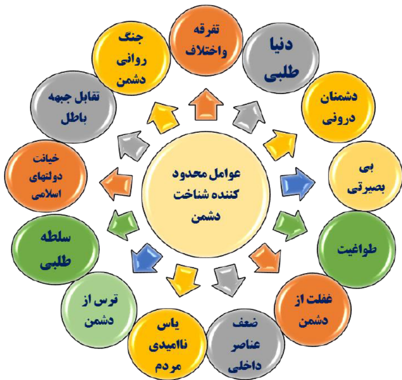
شکل ۴-۷: عوامل محدودکننده شناخت دشمن (محقق ساخته)

بی بصیرتی: حضرت امام خامنه‌ای (مدظله العالی) در این زمینه می‌فرماید: «عزیزان من! تمام مشکلاتی که برای افراد یا اجتماعات بشر پیش می‌آید، بر اثر یکی از این دو است: یا عدم بصیرت، یا عدم صبر. یا دچار غفلت می‌شوند، واقعیت‌ها را تشخیص نمی‌دهند، حقایق را نمی‌فهمند، یا با وجود فهمیدن واقعیات، از ایستادگی خسته می‌شوند. لذاست که به خاطر یکی از این دو، یا هر دو، تاریخ بشر پُر از محنت‌های بزرگ ملت‌هاست؛ پُر از غلبه‌ی زورگویان عالم بر ملت‌های ضعیف‌النفس و غافل است. نقطه‌ی مقابل تقوا، غفلت و بی‌توجهی و حرکت بدون بصیرت است. خدای ناهشیاری مؤمن را در امور زندگی نمی‌پسندد» (بیانات در دیدار گروه کثیری از دانشجویان و دانش آموزان ۱۲/۸/۷۷). موانع دیگری نیز در این زمینه وجود دارد که در بیانات امامین انقلاب ذکر شده و ضمن رعایت اختصار در نمودار زیر درج می‌شود.