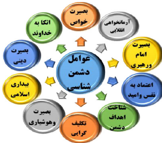
شکل ۲-۷: عوامل مؤثر در دشمن‌شناسی (محقق ساخته)