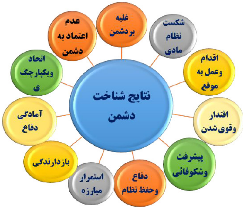
شکل ۵-۷: نتایج و پیامدهای شناخت دشمن (محقق ساخته)