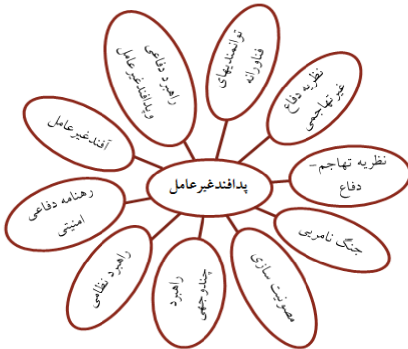
شکل ۱: مدل مفهومی تحقیق

مدل مفهومی تحقیق بر اساس ادبیات برابر شکل زیر احصاء گردیده است: