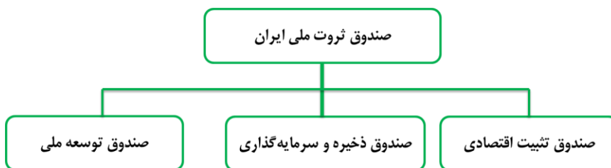
شکل ۳. صندوق ثروت ملی ایران با سه صندوق توسعه، تثبیتی و بین‌نسلی

نکته حائز اهمیت اینکه صندوق‌ها با توجه فلسفه وجودی تشکیل خود، علاوه بر فعالیت در حوزه کارکردی به توانمندسازی و ارتقاء منابع خود نیز اهمیت دهند، درغیراین‌صورت پس از گذشت مدتی تمام منابع آن مصرف گشته و تنها بر اساس ورودی‌های منابعی خود تامین گشته و جایگاه خود در بین سایر صندوق‌های ثروت ملی در دنیا را به‌دست نخواهند آورد.