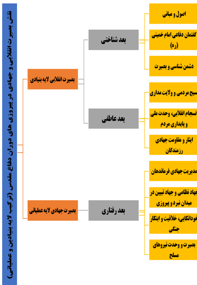
شکل ۱: مدل مفهومی تحقیق

با توجه به موارد بالا مدل مفهومی تحقیق طبق شکل زیر است.