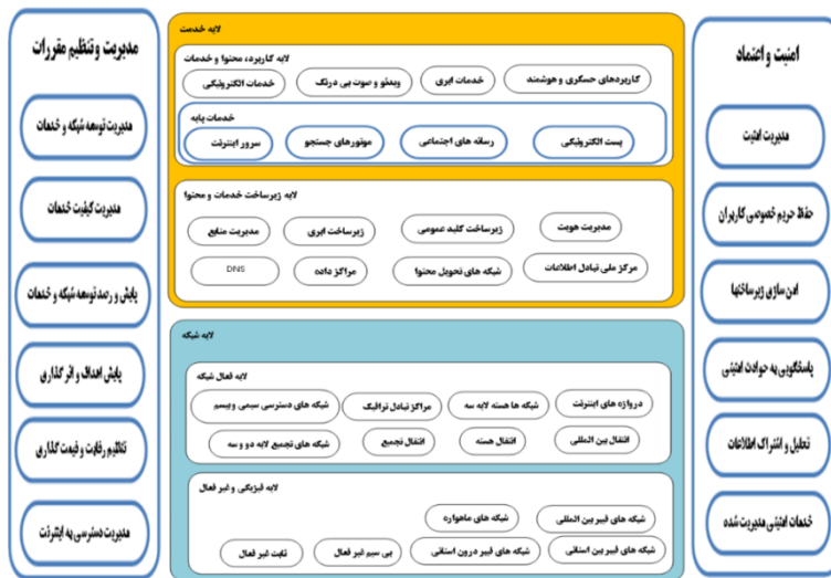
شکل ۱: مدل مرجع شبکه ملی اطلاعات

با توجه به مدل مرجع (شما) و مرور مفاهیم و یافته‌های مطرح‌شده در پیشینه پژوهش، مهم‌ترین ویژگی‌های این شبکه به شرح زیر احصا شده است: