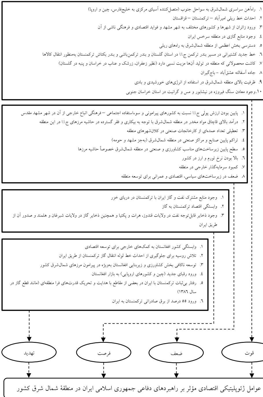
شکل ۲: مدل مفهومی