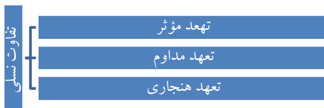
شکل شماره (۱): الگوی مفهومی تحقیق (Jena, 2016; Allen&Meyer, 1990)

تعهدهای هنجاری ۲ سازمانی (NC): این نوع از تعهد سازمانی به میزان واکنش کارکنان به مجموعه قوانین و مقررات در سازمان برمی‌گردد. این متغیر با استفاده از مؤلفه‌هایی چون جابه‌جایی مداوم افراد از یک سازمان به سازمان دیگر، اعتقاد به غیراخلاقی بودن انتقال از یک سازمان به سازمان دیگر، اعتقاد به اهمیت و وظیفه اخلاقی وفاداری به سازمان، اعتقاد بر درست‌نبودن ترک سازمان در صورت ایجاد گزینه بهتر، قابل عملیاتی‌سازی است.