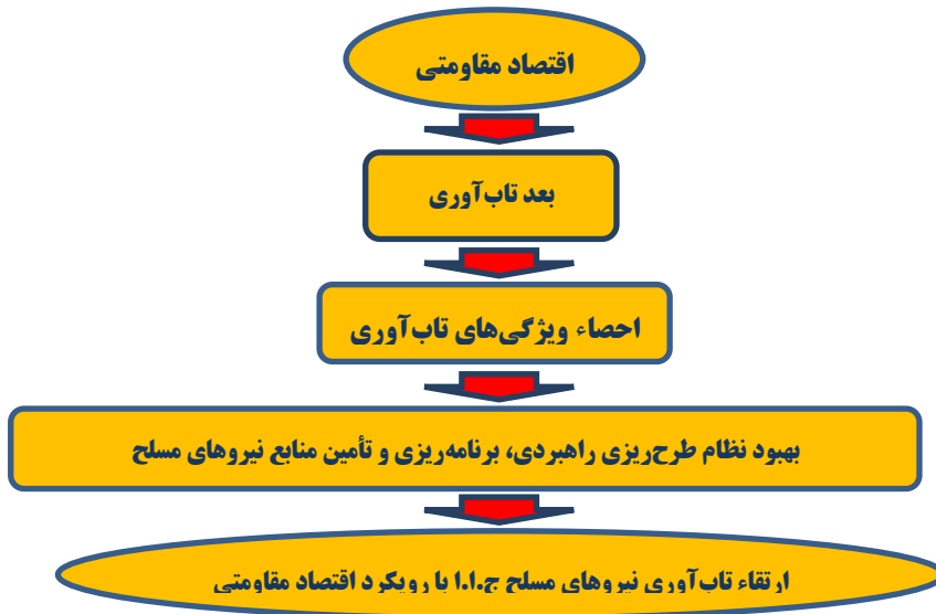
شکل ۱: چارچوب مفهومی پژوهش