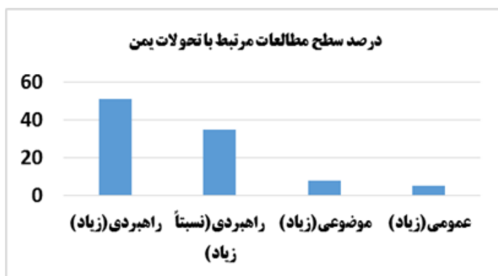
شکل ۴. سطح مطالعات خبرگان

همان‌طور که مشخص است بالغ بر ۶۵ درصد از مشارکت‌کنندگان در این پژوهش با سابقه بیشتر از ۲۰ سال که از سازمان‌ها، ارگان‌ها و نهادهایی چون مراکز آموزشی و تحقیقاتی دفاعی، دبیرخانه شورای عالی امنیت ملی، دبیرخانه شورای امنیت کشور، ستاد کل نیروهای مسلح، وزارت امور خارجه، سپاه پاسداران انقلاب اسلامی، وزارت اطلاعات، ارتش جمهوری اسلامی ایران، وزارت دفاع و پشتیبانی از نیروهای مسلح، مرکز پژوهش‌های مجلس شورای اسلامی و وزارت کشور است، نشان‌دهنده تجربه بالای