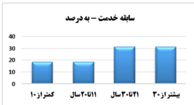
شکل ۲. نمودار سنوات خدمتی خبرگان

ویژگی های جمعیت شناختی نمونه آماری؛ شامل سنوات خدمتی، جایگاه سازمانی، تحصیلات و رشته تحصیلی به شرح زیر می باشد: