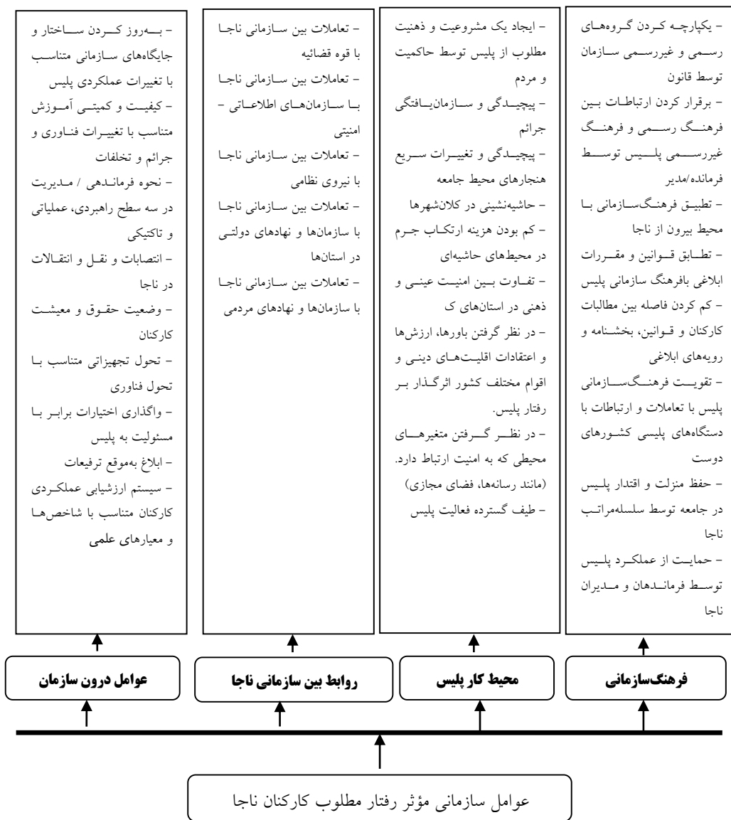
شکل ۲: چارچوب مفهومی

با نگرش به اطلاعات گردآوری شده در قالب مدارک (ادبیات تحقیق، اسناد و مدارک و مصاحبه با صاحب نظران)، چارچوب مفهومی عواملی سازمانی از نگاه محقق که بر رفتار مطلوب پلیس اثرگذار می باشد، در ۴ عامل و ۳۴ گویه شرح ذیل و برابر شکل ۲ ترسیم شده است.