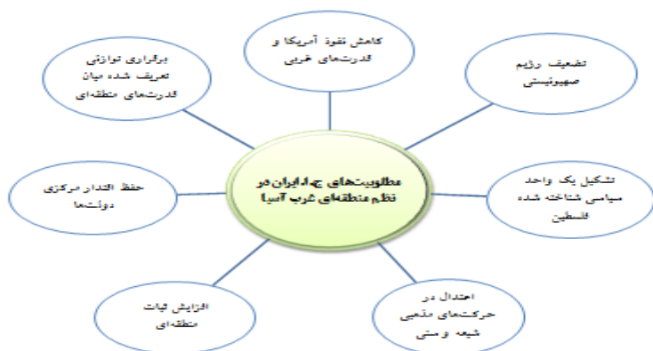
شکل شماره (۲): مطلوبیت‌های ج.ا.ایران در نظم منطقه‌ای غرب آسیا (قاسمی، ۱۳۹۶)

(۷) برقراری توازن تعریف شده میان قدرتهای منطقه‌ای: ج.ا.ایران تلاش دارد توازن در منافع و قدرت میان بازیگران اثرگذار در منطقه شکل دهد و هیچ‌گاه سیاست حذف رقیب را در پیش نمی‌گیرد. این موضوع در مورد ترکیه و عربستان سعودی به عنوان دو رقیب منطقه‌ای صدق می‌کند. البته ج.ا.ایران دست‌یابی به این توازن را از طریق الگوهای همکاری‌جویانه میسر می‌داند نه الگوهای تعارض. (قاسمی، ۱۷-۱۳۹۶: ۲۰)