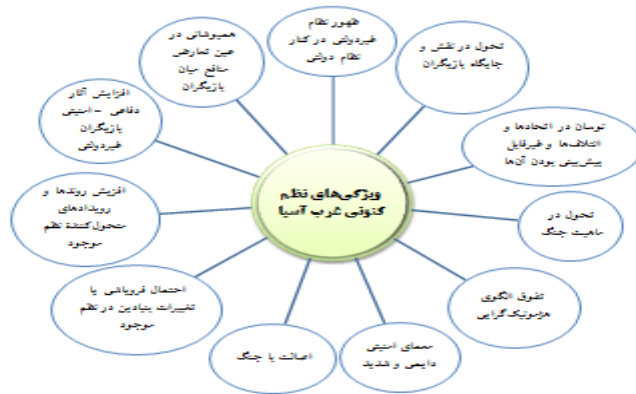
شکل شماره (۱): ویژگی‌های نظم فعلی غرب آسیا (نقدی، ۱۳۹۷)