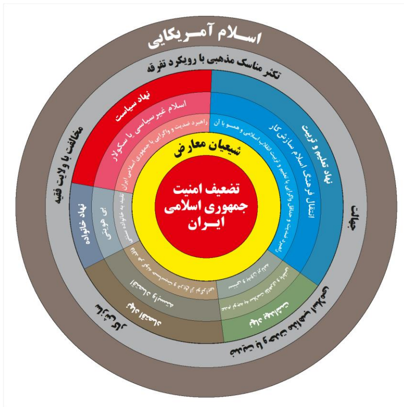
نمودار ۲ - شبکه معارض و ضد شیعه (راشد، ۱۴۰۰: ۱۳۵-۱۳۷)

موانع ساختاری پیش گفته، کارگزارانی نیز دارد. «دولتمردان ضد اسلام»، «نمایندگان ضد اسلام پارلمان‌ها»، «کشیشان یا خاخام‌های ضد وحدت ادیان» و «رسانه‌های متأثر از صهیونیسم بین‌الملل» از جمله مهمترین موانع کارگزاری هستند که به شکل مستقیم یا غیرمستقیم مانع از انسجام مسلمانان - و به تبع آن، شبکه‌سازی شیعیان - می‌شوند. نمودار ذیل، به صورت جامع، مهم‌ترین تهدیدات و چالش‌های جهان تشیع را به صورت حلقه‌وار نشان می‌دهد که نتیجتاً به تضعیف امنیت نظام جمهوری اسلامی ایران منجر می‌شود: