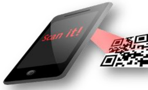
شکل (۱) نحوه اسکن اطلاعات توسط نشانگر کیوتوریسم

و با توسعه سخت افزارها و نرم افزارها، دیدگاه استفاده از محیط مجازی و دنیای وب نیز در فعالیتهای دیگر به ویژه گردشگری در حال تغییر است (Kenteris; 2010) و در مناطق مختلف از فناوریهای الکترونیکی در گردشگری از جمله سه بعدی سازی محیط گردشگری. (Buyukuzkan & Ergu; 2011) و سیستمهای هوشمند الکترونیک (Gartner; 2010: 21) استفاده شده است. کیوتوریسم، پروژه ای است که رویکرد آن اضافه کردن واقعیت افزوده به محیطهای گردشگری است. در این فناوری، نشانگرها و بارکدهایی در مناطق کویری گردشگری یا سایر نقاط هدف، نصب می شود (اروجی و همکاران؛ ۱۳۹۳) که این بارکدها حاوی اطلاعات جامع به صورت متن، صدا، تصویر، فیلم و غیره در مورد جاذبه یا موارد دیگر می باشد. گردشگران از طریق دانلود نرم افزار کیوتوریسم و نصب در گوشی موبایل یا دستگاههای مشابه و اسکن اطلاعات بارکدها از طریق گوشی، می توانند بدون نیاز به داشتن راهنما، اطلاعات جامعی از جاذبهها به دست بیاورند. (Fuchs et al; 2012: 34).