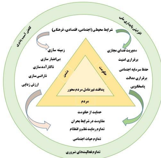
شکل ۲- مدل مفهومی

به منظور وصول به مدل مفهومی تحقیق، ضمن بهره‌برداری از دستمایه‌های حاصل از مرور ادبیات، میزگرد تخصصی با حضور جمعی از صاحب‌نظران تشکیل و پس از مشورت و تبادل نظرات در میزگرد تخصصی مدل مورد نظر برابر با شکل شماره ۲ ترسیم گردید.