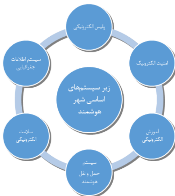
شکل 2. مدل مفهومی زیرسیستم های شهر هوشمند

خدمات پلیس الکترونیک طراحی شده است. با این حال، پلیس الکترونیک شامل سایر خدمات اضطراری نیز همچون اورژانس، آتش نشانی و... می شود، چراکه از یک فرمان واحد، یا مرکز موقعیتی (مرکز کنترل مأموریت)، استفاده می کند. شکل (2)، مدل مفهومی زیرسیستم های شهر هوشمند را نمایش داده است.