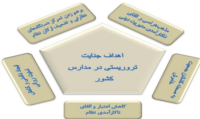
شکل شماره ۱. مدل مفهومی پژوهش