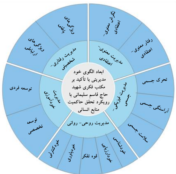
شکل (۲). طراحی الگوی خود مدیریتی با تأکید بر مکتب فکری شهید حاج قاسم سلیمانی با رویکرد تحقق حاکمیت منابع انسانی