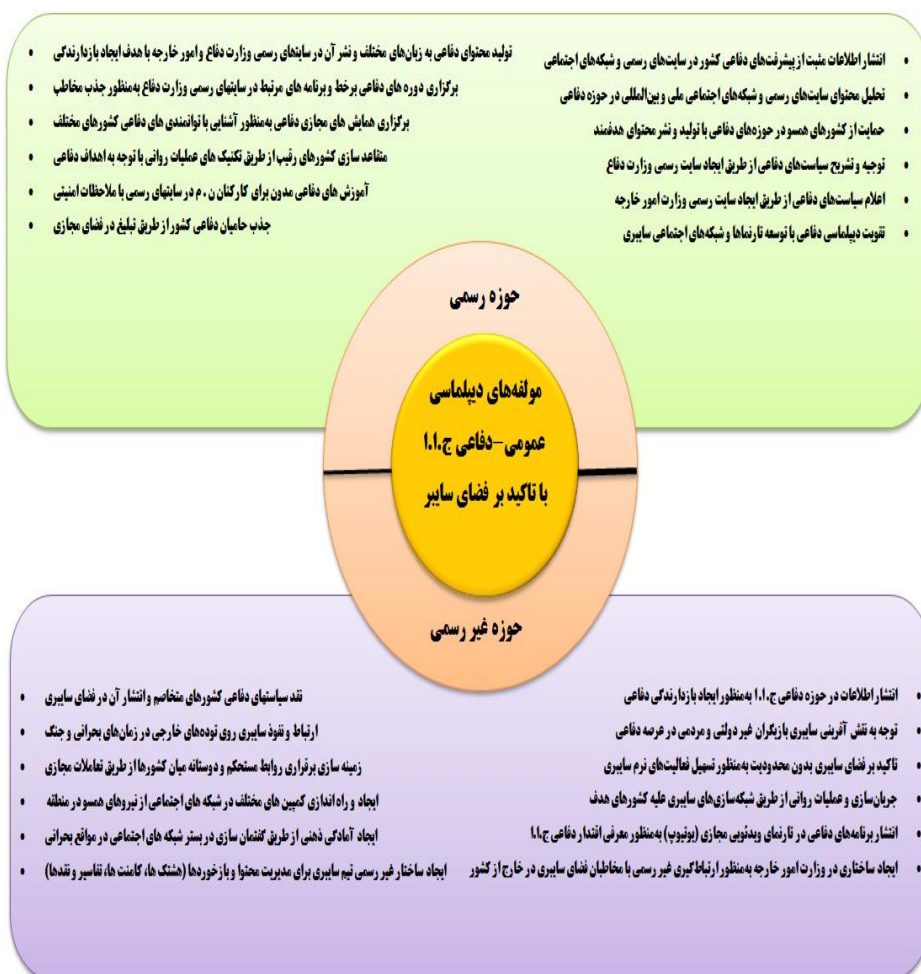
شکل شماره ۱. چارچوب نظری پژوهش

در یک جمع‌بندی کلی از مطالعه متون مرتبط با دیپلماسی به‌ویژه دیپلماسی دفاعی و سایبری، دفاع و بررسی پژوهش‌های صورت گرفته در زمینه موضوع، الگوی اولیه مؤلفه‌های دیپلماسی عمومی-دفاعی جمهوری اسلامی ایران با تأکید بر فضای سایبر، شناسایی و با انجام مصاحبه با خبرگان، ضمن مقایسه و تلفیق عوامل مؤثر به‌دست‌آمده از ادبیات تحقیق و نظرات خبرگان، چارچوب نظری پژوهش به شرح زیر طراحی و ارائه گردید.