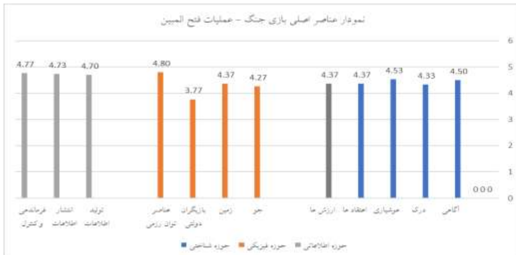
نمودار ۲: عناصر اصلی بازی جنگ عملیات فتح المبین

نتیجه نظرخواهی در خصوص این سؤال در بعد عناصر اصلی بازی جنگ عملیات فتح المبین، نظر جامعه آماری در حوزه فیزیکی شامل جو، زمین و عناصر توان رزمی می‌باشند که برابر جدول و نمودار یاد شده مورد تایید قرار گرفته است و میزان تاثیر آنها بالاست. ضمناً بازیگران دولتی با میانگین کمتر از ۴ از عناصر اصلی حذف گردیده‌اند. نظر جامعه آماری در حوزه شناختی شامل آگاهی، درک، هوشیاری، اعتقادها و ارزش‌ها می‌باشند که برابر جدول و نمودار یاد شده مورد تایید قرار گرفته است و میزان تاثیر آنها بالاست. همچنین نظر جامعه آماری در حوزه اطلاعاتی شامل تولید اطلاعات، انتشار اطلاعات و فرماندهی و کنترل می‌باشند که برابر جدول و نمودار یاد شده مورد تایید قرار گرفته است و میزان تاثیر آنها بالاست.