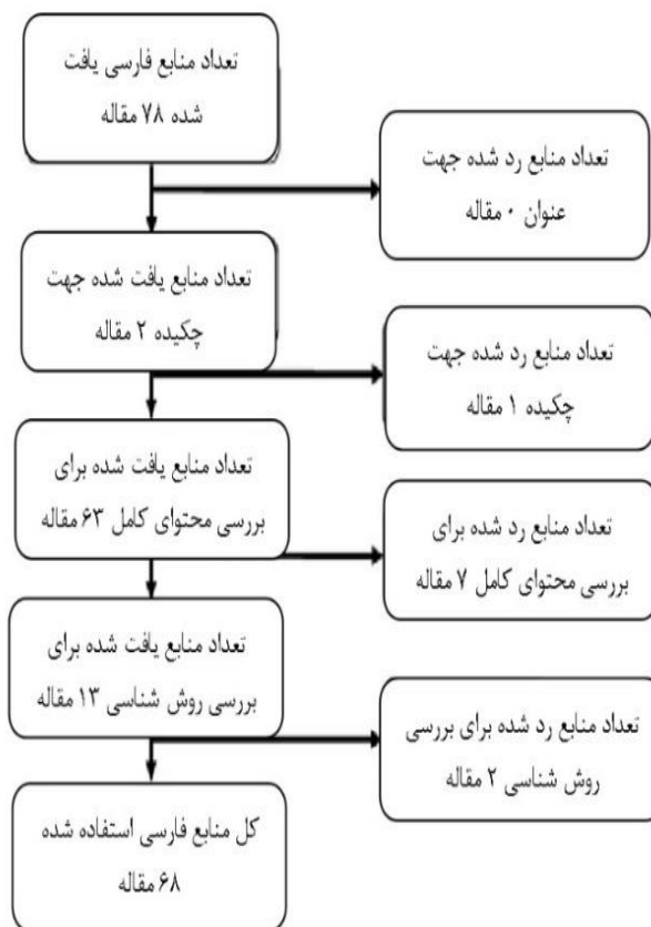
شکل شماره ۱. الگوریتم انتخاب منابع نهایی فارسی

جستجو و جمع‌آوری ادبیات استفاده‌شده در پژوهش را در قالب مقالات فارسی و انگلیسی نمایش داده است.