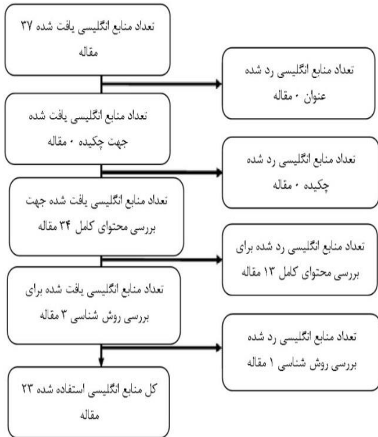
شکل شماره ۲. الگوریتم انتخاب منابع نهایی انگلیسی

جمع‌آوری کرد. ثبت‌ها یا مضمون‌ها باید با توجه به جزئیات هر پژوهش درباره‌ی موضوع موردبررسی باشد.