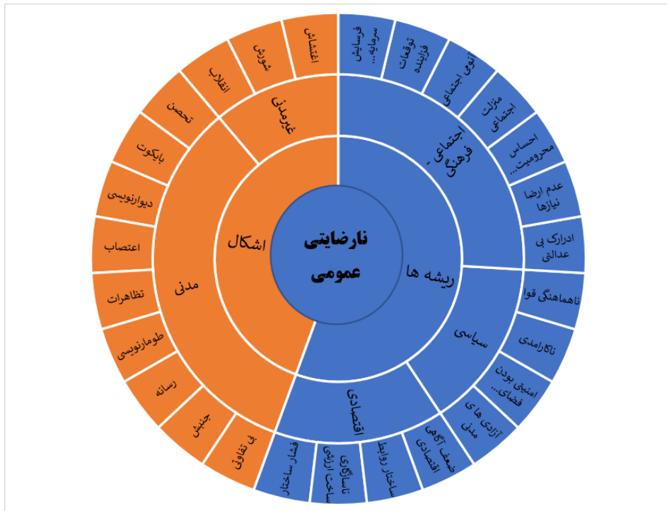
شکل شماره ۳. ریشه‌ها و اشکال بروز نارضایتی عمومی در ج.ا.ایران (یافته‌های نگارندگان)