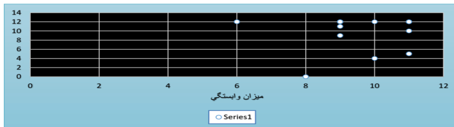
نمودار شماره (۱). نمودار میزان نفوذ و وابستگی ویژگی‌ها

اطلاعات جدول (۹) به تنهایی نمی‌تواند به فهم روابط میان ویژگی‌ها کمک کند، بنابراین برای تحلیل آن به نمودار شماره (۱) نیاز است که به نمودار MICMAC معروف است. در این نمودار میزان نفوذ و وابستگی ویژگی‌ها در یک ماتریس و به صورت یکجا قابل مشاهده است: