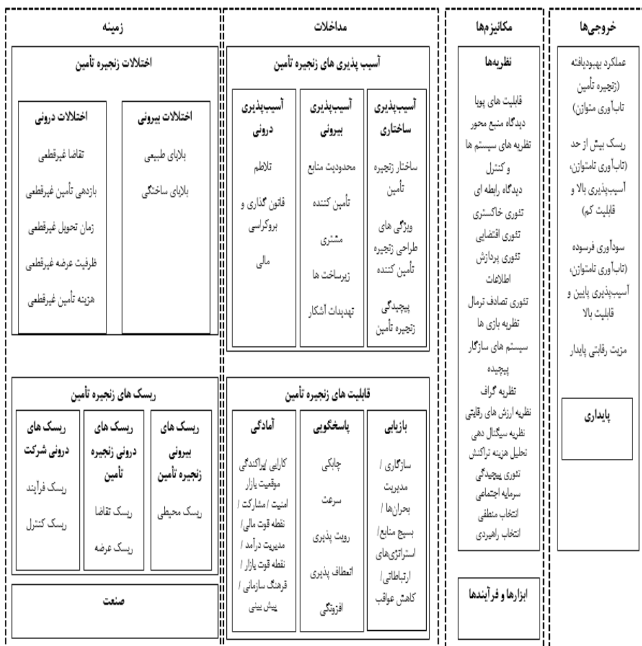
شکل شماره ۲. الگوی زنجیره تأمین تاب‌آور (کوچان و نویکی، ۲۰۱۸)

پس از تعریف تاب‌آوری زنجیره تأمین به منظور درک بهتر این مفهوم در زنجیره تأمین و برخورداری از رویکردی جامع و کامل نسبت به این مفهوم، چارچوب یک زنجیره تأمین تاب‌آور مطابق شکل (۲) می‌باشد.