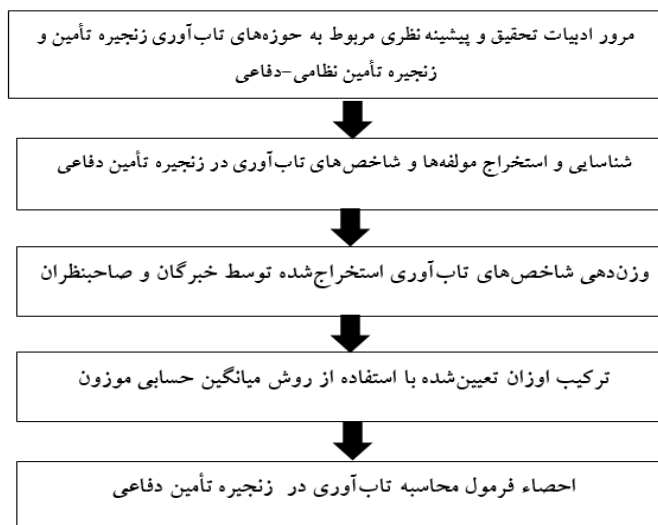
شکل شماره ۳. گام‌های تحقیق

فرم وزن‌دهی شاخص‌ها جهت آگاهی از نظرات خبرگان، میان آن‌ها توزیع شد. در این فرم ۱۱ شاخص تاب‌آوری زنجیره تأمین دفاعی مطابق جدول (۴) قید گردید تا خبرگان به وزن‌دهی شاخص‌های تعیین‌شده از ۱ تا ۲۰ پردازند. خبرگان این تحقیق از خبرگان و اعضای هیئت علمی پژوهشکده آماد، فناوری و عرصه‌های نوپدید مرتبط با این حوزه در دانشگاه عالی دفاع ملی انتخاب شدند. به‌منظور ترکیب اوزان تعیین‌شده توسط هر یک از خبرگان و صاحب‌نظران، روش‌های متعددی نظیر فراوانی نسبی، میانگین حسابی موزون، آنتروپی شانون، انحراف معیار، استفاده از ماتریس‌های مقایسات زوجی و روش سوارا وجود دارد (اصغری‌زاده و محمدی بالانی، ۱۳۹۷). اما غالب آن‌ها به‌جز روش میانگین حسابی موزون به شاخص‌هایی که واگرایی بیشتری نسبت به شاخص‌های دیگر دارند، اهمیت بیشتری می‌دهند که این مورد در این تحقیق مدنظر محقق نیست.