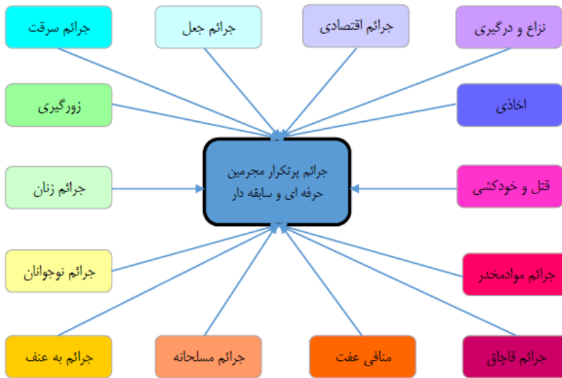
شکل (۲): شبکه جرم‌های تکرار مجرمین حرفه‌ای و سابقه‌دار