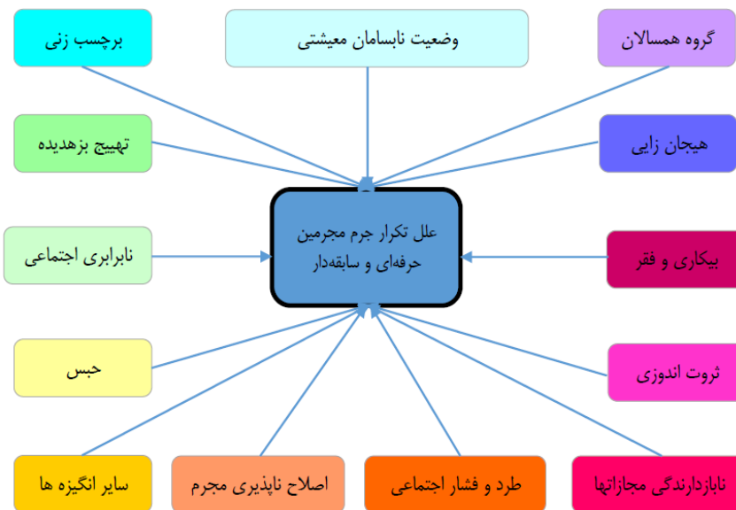
شکل (۳): شبکه علل جرم‌زایی مجرمین حرفه‌ای و سابقه‌دار