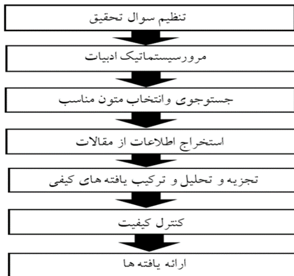
شکل شماره ۲. مراحل پیاده‌سازی فراترکیب (باروس و ساندلوسکی، ۲۰۰۶).

با بررسی و انجام موارد فوق، بسترها به‌منظور ارائه یک خط‌مشی در به‌کارگیری اینترنت اشیا فراهم می‌شود. در تحقیق حاضر به‌منظور تحقق هدف مطالعه، با بهره‌گیری از فرایند هفت مرحله‌ای «ساندلوسکی و باروس» ۱ ، پژوهش‌های گذشته در حوزه سیاست‌ها، الزامات و یا خط‌مشی‌گذاری در فناوری‌های دیجیتال و یا اینترنت اشیا بررسی شده است. خلاصه