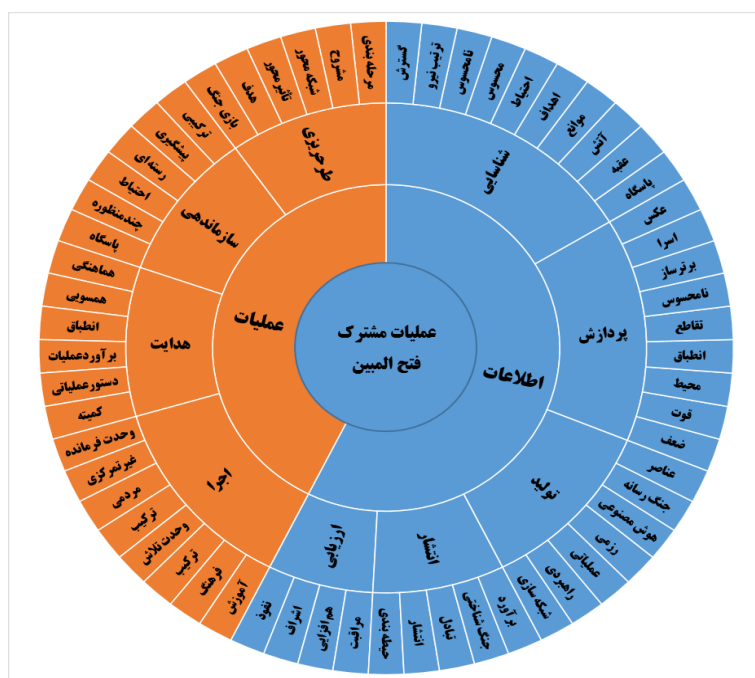
شکل شماره ۲: الگوی تحقیق