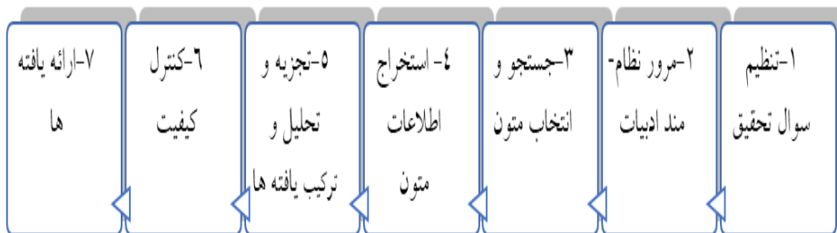
شکل شماره ۱. مراحل اجرای تحقیق

به‌کارگیری روش فراترکیب مستلزم این است که پژوهشگر بازنگری دقیق و عمیقی انجام دهد و یافته‌های پژوهش کیفی مرتبط را ترکیب کند. پژوهشگران از طریق یافته‌های مقالات اصلی پژوهش، واژه‌هایی را آشکار و ایجاد می‌کنند که نمایش جامع‌تری از پدیده‌های مورد بررسی نشان می‌دهد. در پژوهش حاضر جهت دستیابی به هدف تحقیق، از روش فراترکیب مطابق با الگوی هفت‌مرحله‌ای سندلوسکی و باروسو (۲۰۰۷) به شرح شکل (۱) استفاده شده است.