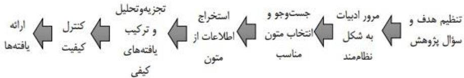
شکل ۱. گام‌های روش فرا ترکیب

برای یک‌پارچه‌کردن پژوهش‌ها به شکلی نظام‌مند، جامع و قابل فهم است. در روش «فرا ترکیب» داده‌های اصلی پژوهش‌های منتخب، ترکیب و تفسیر می‌شود. هرچند روش فرا ترکیب با روش «مرور نظام‌مند پیشینه پژوهش» دارای شباهت‌هایی است، اما تفاوت‌های مبنایی نیز با آن دارد. برای نمونه روش «فرا ترکیب» به مطالعات مقدماتی مبتنی بر گفتگو و تعامل با یکدیگر و تلاش خلاقانه پژوهشگر نیاز دارد. به دلیل جدید بودن و کم بودن منابع مربوط به موضوع حکمرانی پیش‌نگر، برای پیشنهاد الگوی مفهومی از روش «فرا ترکیب» استفاده شد. روش فرا ترکیب دارای نوآوری نسبی در پژوهش است. در یافته‌های پژوهش، توصیف نظری جدیدی همراه با پیشنهاد‌های کاربردی ارائه شده است. در این پژوهش به دلیل اینکه الگوی سندلوسکی و باروسو (۲۰۰۷) در پژوهش‌های فرا ترکیب بیشترین استفاده را داشته است به کار گرفته شده است. مراحل روش فرا ترکیب در شکل شماره ۱ نشان داده شده است: