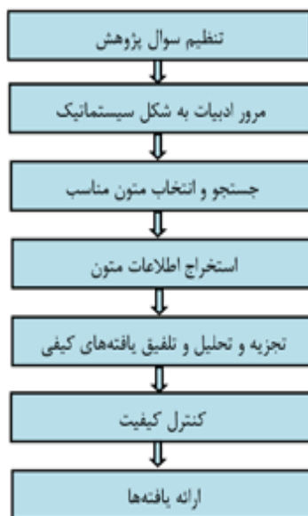
شکل ۱- نمودار هفت مرحله‌ای سندلوسکی و باروسو

این پژوهش از نظر هدف، توسعه‌ای-کاربردی و از نظر روش فراترکیب است که نوعی روش کیفی است. روش فراترکیب مستلزم این است که پژوهشگر بازنگری دقیق و عمیقی انجام داده و یافته‌های پژوهش‌های کیفی مرتبط را ترکیب کند. از طریق بررسی یافته‌های مقاله‌های اصلی پژوهش، پژوهشگران واژه‌هایی را ایجاد می‌کنند که نمایش جامع‌تری از پدیده تحت بررسی را نشان می‌دهد (سهرابی و همکاران، ۱۳۹۰: ۶). در این پژوهش برای تحقق این هدف، از روش هفت مرحله‌ای سندلوسکی و باروسو ۱ (۲۰۰۷) استفاده شده است. در این روش با مراجعه به منابع علمی که در زمینه خودسازی، جامعه‌پردازی، مکتب مدیریتی شهید سلیمانی صورت گرفته است، تعداد ۶۴۷ مورد پژوهشی در زمینه شهید سلیمانی و بیانیه گام دوم انقلاب به شرح زیر مورد بررسی قرار گرفته است: