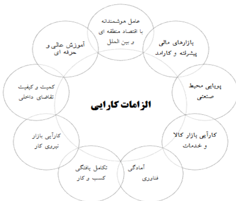
شکل ۳. مولفه‌های تشکیل دهنده الزامات کارایی

الزامات پایه و تحت عنوان سرمایه انسانی. همچنین مصادیق آموزش عالی و حرفه‌ای نیز عبارتند از: ۱. کیفیت سیستم آموزش عالی و حرفه‌ای، ۲. دسترسی به متخصصین، ۳. کیفیت تحقیقات و پژوهش‌های علمی، ۴. کیفیت همکاری دانشگاه و صنعت.