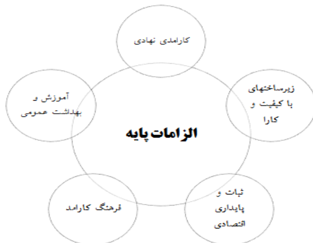
شکل ۲. پنج مولفه تشکیل‌دهنده الزامات پایه