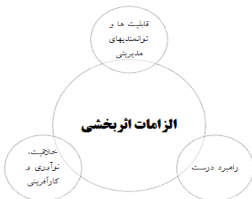
شکل ۴. مولفه‌های تشکیل دهنده الزامات اثربخشی