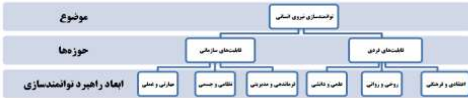
شکل ۱: ابعاد راهبرد توانمندسازی نیروی انسانی (محقق ساخته)

مدل مفهومی تحقیق: مدل مفهومی این تحقیق مبتنی بر ماهیت و ساختار توانمندسازی نیروی انسانی و با در نظر گرفتن مؤلفه‌ها و شاخص‌های هر دو بعد قابلیت‌های فردی و سازمانی به شرح شکل ۲ است: