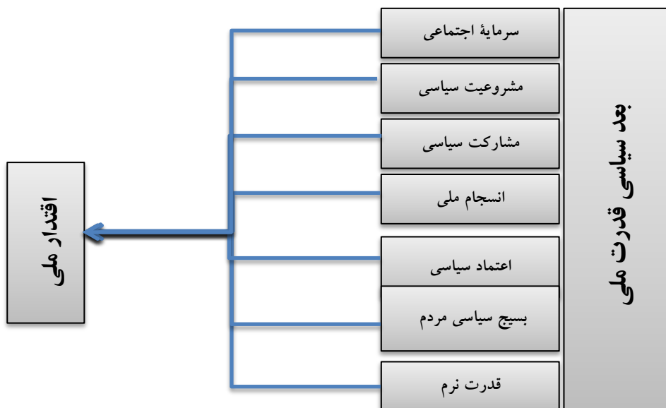
شکل شماره (۱): الگوی تجربی مؤلفه‌های بعد سیاسی قدرت ملی جهت تقویت اقتدار ملی