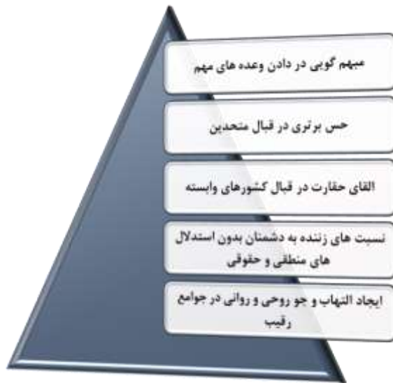
شکل ۴: شاخصه‌های نارسیسیستی ترامپ در عرصه سیاست

شخصیت نارسیسیستی ترامپ در قبال جمهوری اسلامی ایران را می‌توان ذیل چند مسئله تبیین نمود. نخست در دوران رقابت‌های انتخاباتی و تبیین این مسئله که برجام یکی از فاجعه‌آمیزترین دستاوردهای دیپلماسی ایالات متحده بوده است، قول خروج از برجام را داد و سپس با اعلام این مسئله که به اعمال شدیدترین تحریم‌ها علیه ایران مبادرت خواهد نمود، نوعی التهاب و جو روانی را در داخل ایران ایجاد نمود. سپس با اعمال تهدیدات نظامی علیه ایران به اعزام ناوبر ابراهام لینکن به آب‌های خلیج فارس مبادرت نمود. به نظر نویسندگان، این مسائل بیش از آنکه جنبه حقیقی داشته باشد، مبتنی بر مسائل روان‌شناسی و شخصیت‌مبتنی بر خودشیفتگی ترامپ است. این مسئله پیش‌تر نیز در ملاقات حضوری با کیم جونگ اون، رهبر کمونیستی کره شمالی به وقوع پیوست. ترامپ با برگزاری این نشست، سعی در ایجاد فضایی روانی برای مردم آمریکا و جهان داشت تا این مسئله را به اثبات برساند که تنها وی توانایی این مسئله را داشته است که بتواند یکی از سرکش‌ترین رهبران جهان را به میز مذاکره فراخواند، هرچند این نشست عملاً دستاوردی برای ایالات متحده و کره شمالی به همراه نداشت.