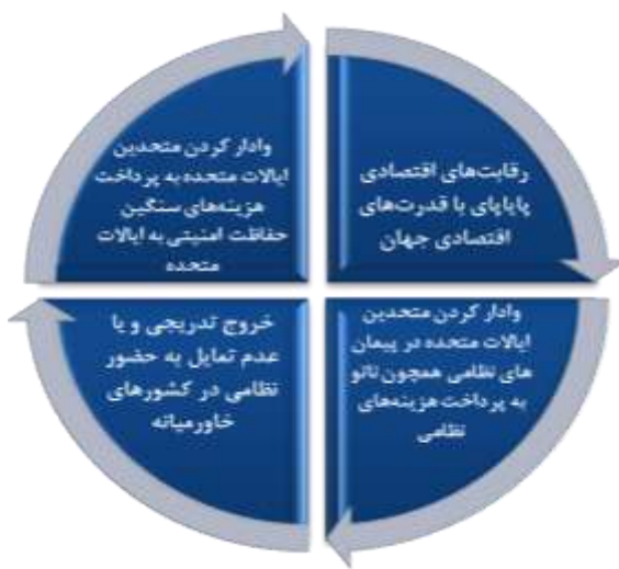
شکل ۵: شاخصه‌های اقتصادی ترامپ در عرصه سیاست

۴. وادار کردن متحدین ایالات متحده در پیمان‌های نظامی همچون ناتو ۱ به پرداخت هزینه‌های نظامی.