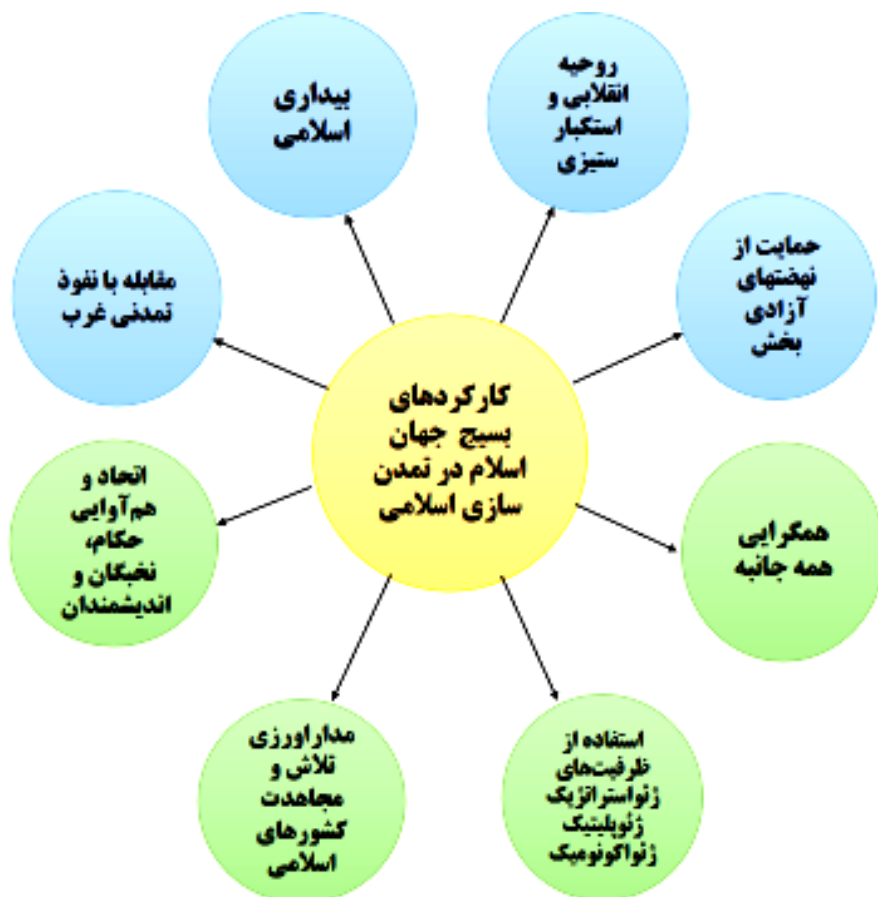
نمودار ۳. کارکردهای رفتاری بسیج جهان اسلام در تمدن سازی اسلامی (یافته‌های تحقیق)

براین اساس، یافته‌های تحقیق که مبین کارکردهای رفتاری بسیج جهان اسلام در تمدن سازی اسلامی است، به شرح نمودار ذیل قابل مشاهده می‌باشد.